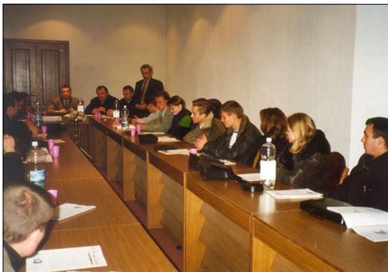
Aspect de la un seminar din cadrul programului “Școli electorale”