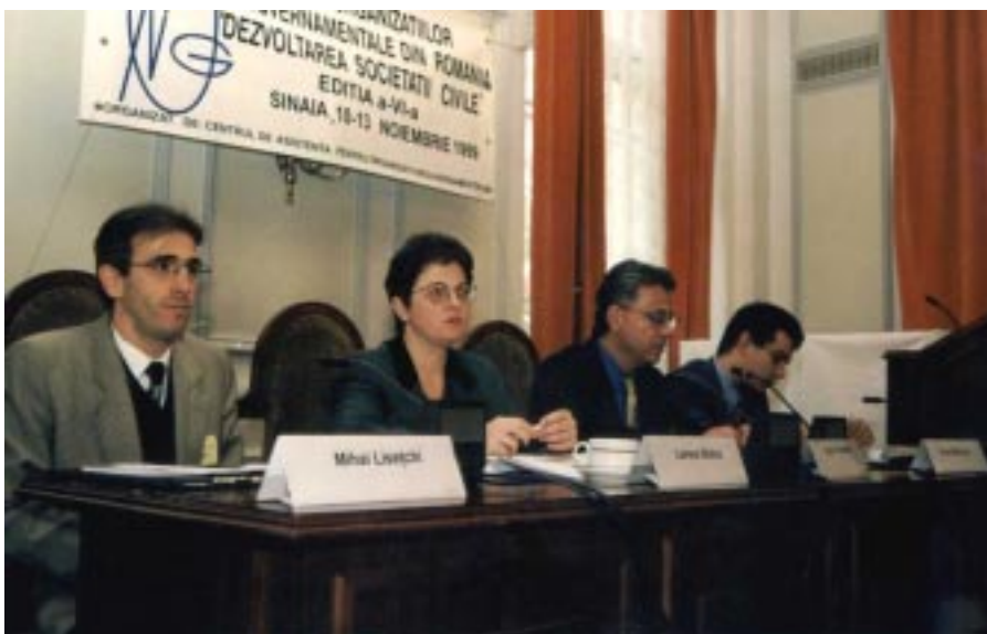
Aspect de la a 6-a ediție a Forumului Organizațiilor Neguvernamentale din România

Formulînd strategia de dezvoltare a sectorului non-profit, și inițind un dialog cu organizațiile finanțatoare, GIR și-a depășit oarecum mandatul. Iată de ce printre propunerile formulate de GIR se numără următoarele: lărgirea mandatului GIR în sensul de a se acorda și un mandat de reprezentativitate în chestiuni specifice și de interes general pentru sectorul neguvernamental românesc, dele-