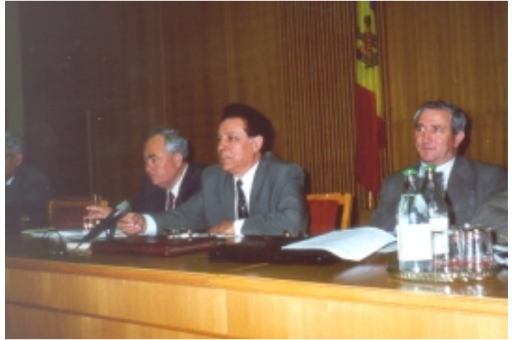
На снимке: Работа семинара организованного IFES-Moldova и Центральной избирательной комиссией 21 июня в уезде Кишинэу