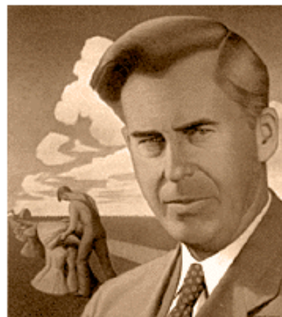
Henry A. Wallace (Pictor Grant Wood)

Tel: (202) 452 - 1530, fax: (202) 452 - 0922, E-mail: tkroll@wgf.org, http://www.wgf.org